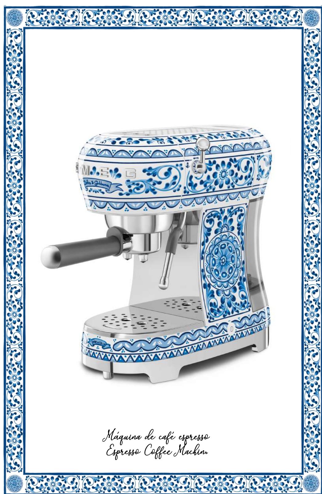
Máquina de café espresso Espresso Coffee Machine