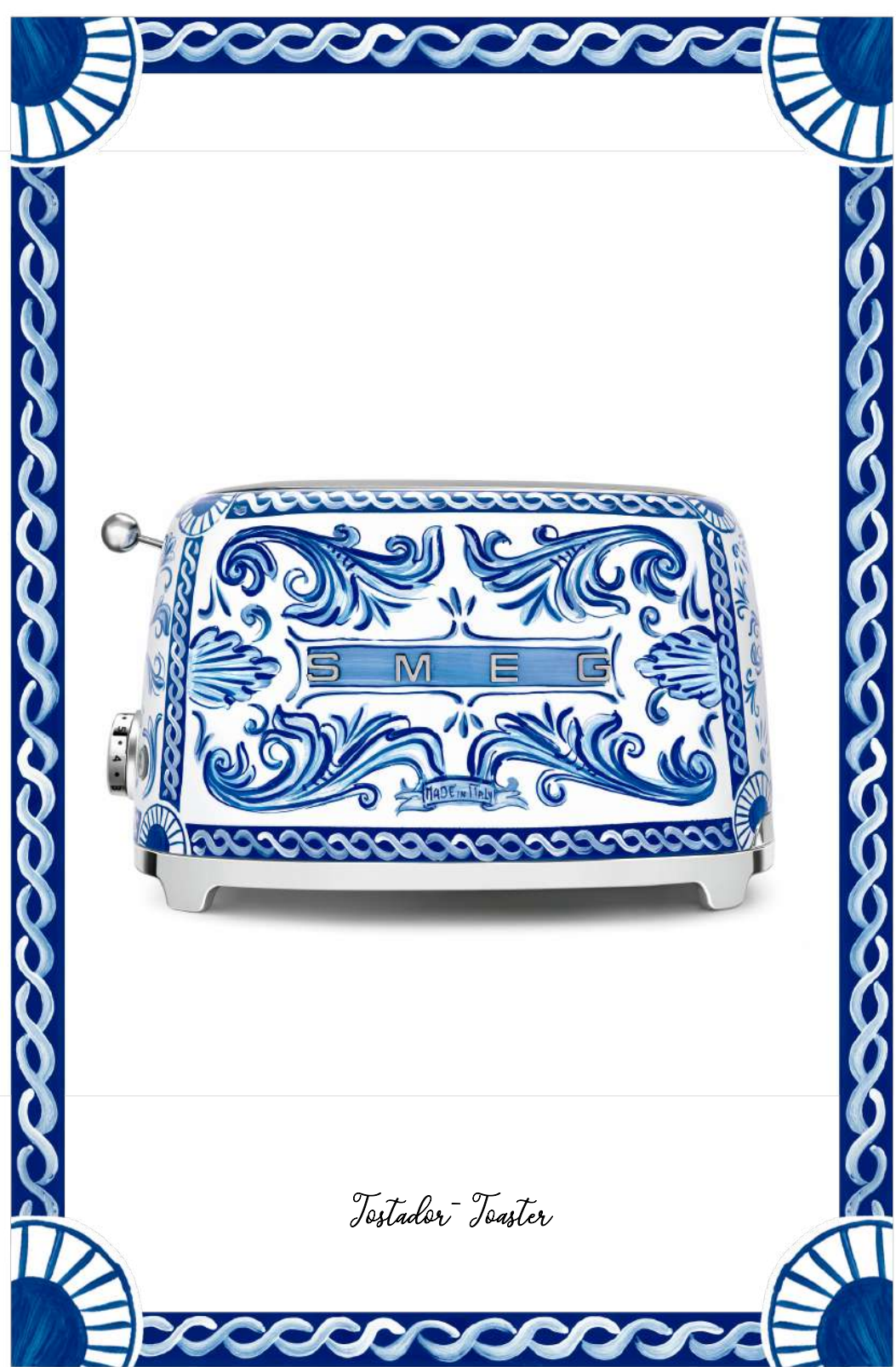
Tostador - Toaster