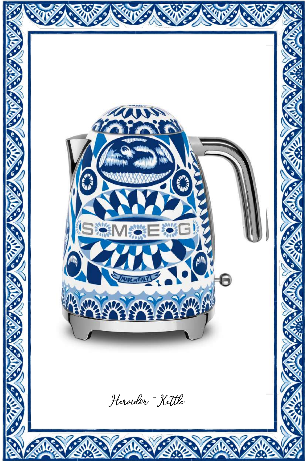
Hervidor - Kettle