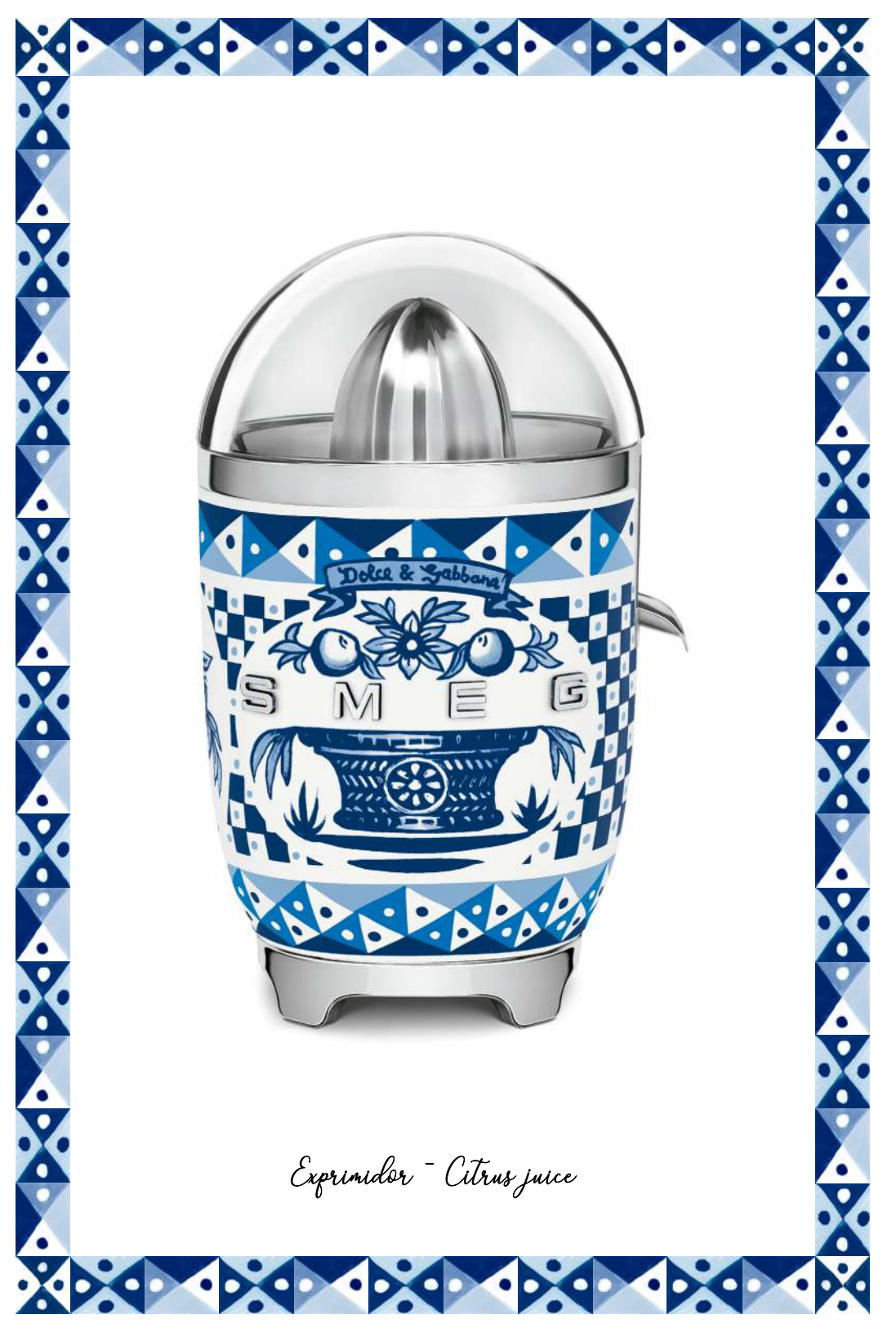
Exprimidor - Citrus juice